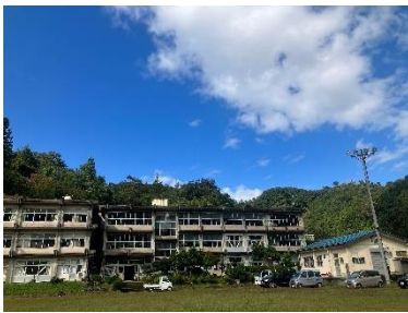
【旧神戸小学校 景観】

神戸地区は「神戸の桃」が特産品となっています。この桃の収穫と販売期には、くず桃といって、売り物にならない桃が今まで廃棄されてきました。このくず桃を何かに役立てて欲しいとの声を聞き、まだまだ食べられる食品が廃棄される問題を、SDGsの観点からも、地域の活性化と子ども達への食育にもぜひ活用していきたいと思い「桃フェス」イベントを企画しました。